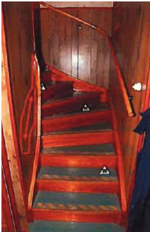
Bild på trappan upp till övervåningen (blodavstrykning på väggen vid det inre vagnstycket markerad på vänster sida)