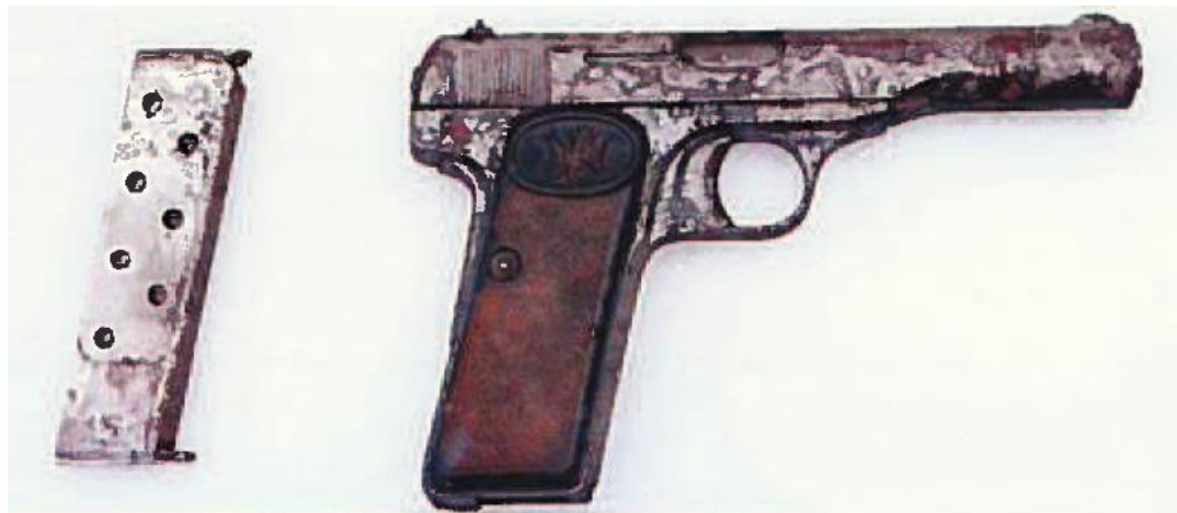
Bild av den aktuella pistolen